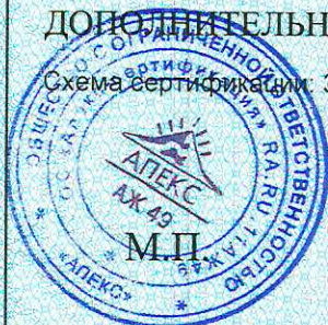
Схема сертификата: 3