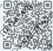
Схема сертификации: 1с (ГОСТ Р 53603-2020 Оценка соответствия. Схемы сертификации продукции в Российской Федерации)

Проверить подлинности сертификата соответствия