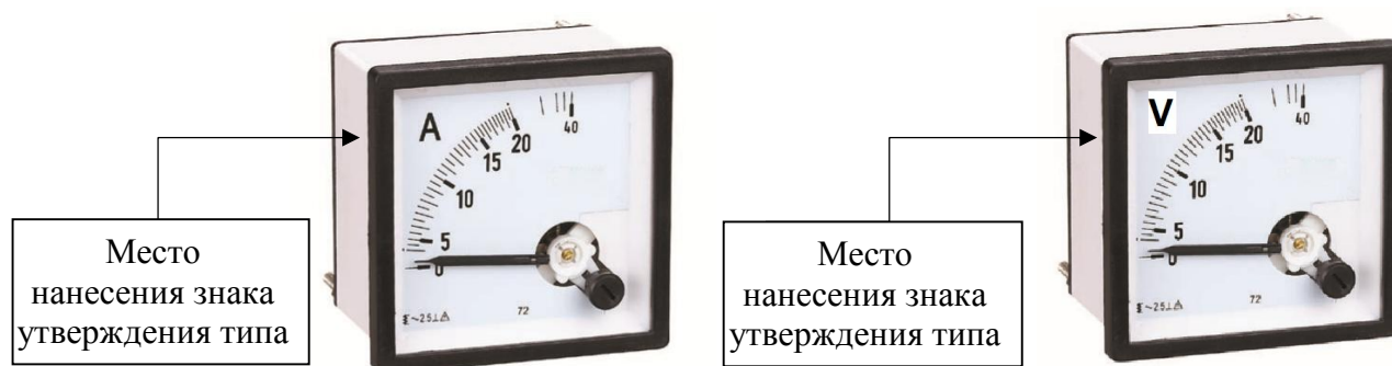
Рисунок 1 - Общий вид амперметров и вольтметров с указанием мест нанесения знака утверждения типа

Пломбирование амперметров и вольтметров не предусмотрено.