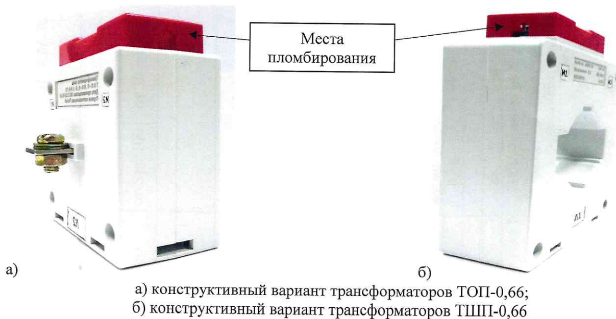
Рисунок 2 - Места пломбирования от несанкционированного доступа