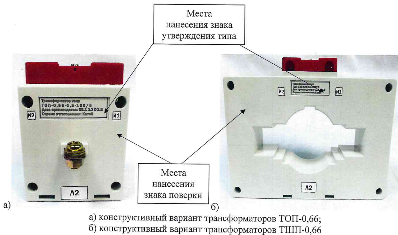
Рисунок 1 – Общий вид трансформаторов с местами нанесения знака поверки и знака утверждения типа