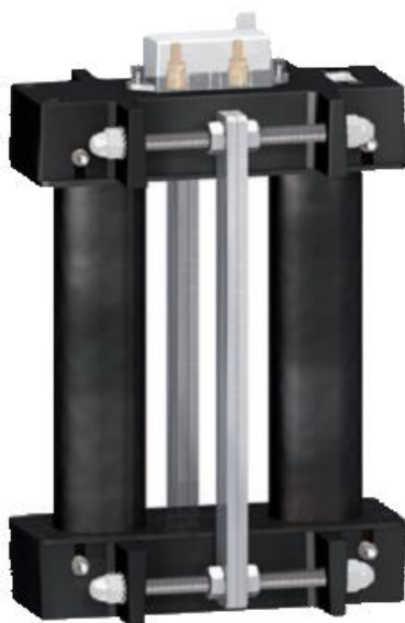
Рисунок 1 – Внешний вид трансформаторов