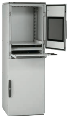
0 474 01