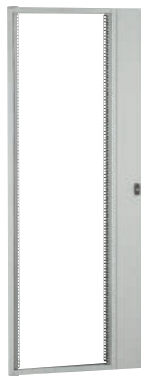
0 482 04