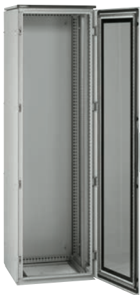
0 473 62 с боковыми панелями 0 472 72 и стойками 0 482 20