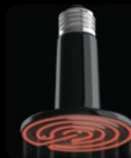
КЕРАМИЧЕСКАЯ ЛАМПА E27 FITO-150W-HQ Б0052716