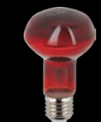
Инфракрасная лампа ИКЗК 230-60 R63 Б0057281