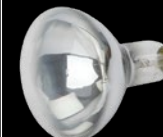
Инфракрасная лампа ИКЗ 220-250 R127 Б0055440