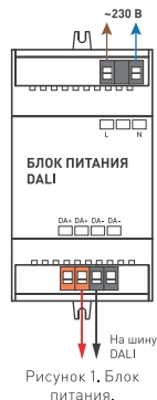
Рисунок 1. Блок питания.