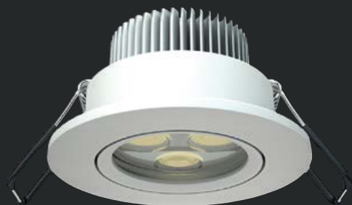
DL SMALL 2021-5 LED WH