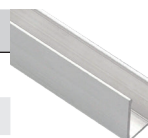
Профиль PAL 0612