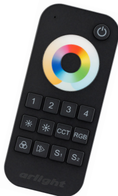
SMART-R22-MULTI Black Арт. 023473