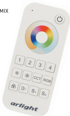
SMART-R20-MULTI White Арт. 023471