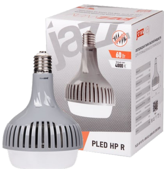
PLED-HP R170 60W