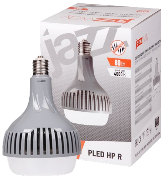
PLED-HP R190 80W

Обновленная серия светодиодных ламп высокой мощности PLED-HP R jazzway используется для общего освещения внутренних и наружных объектов (производственные помещения, складские помещения, автостоянки, парковки, дворовые территории, строительные площадки и т.п.).