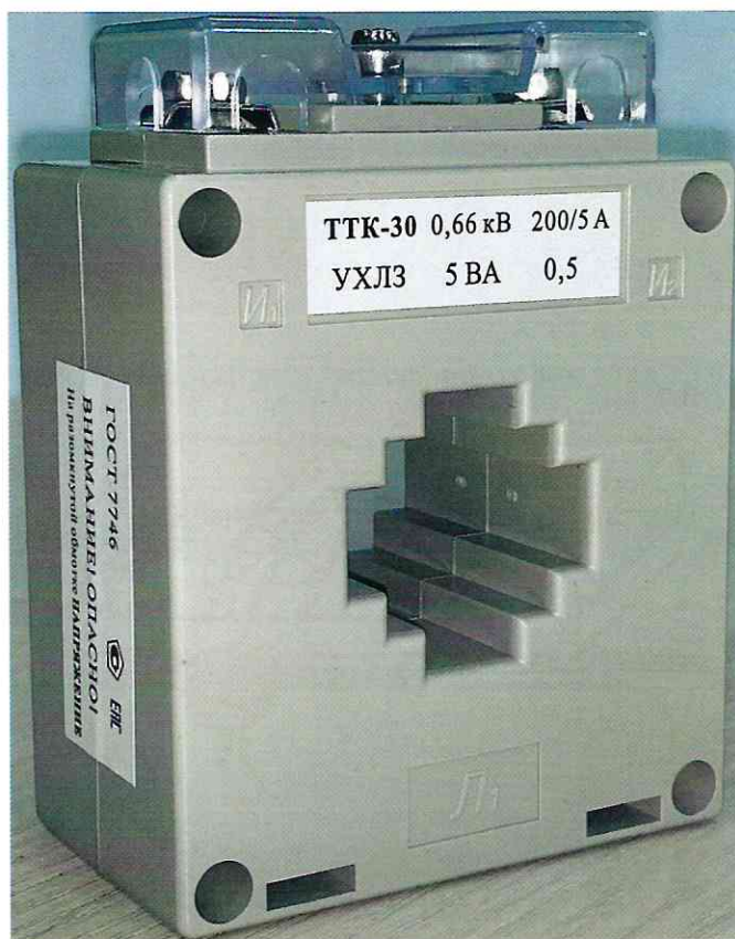
Рисунок 2 – Общий вид трансформаторов тока ТТК-30