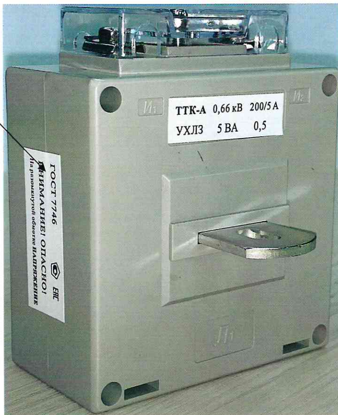
Рисунок 1 – Общий вид трансформаторов тока ТТК-А