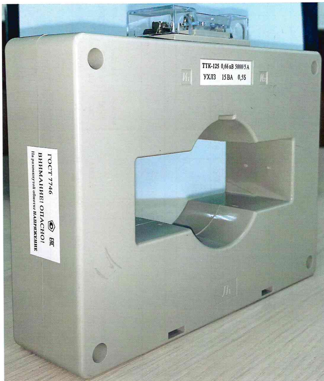
Рисунок 3 – Общий вид трансформаторов тока ТТК-125