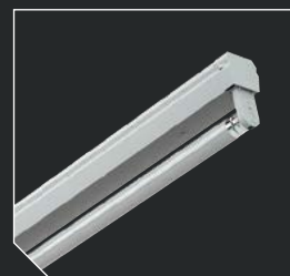
BAT LED TUBE