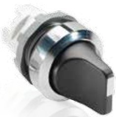
Переключатель с короткой ручкой