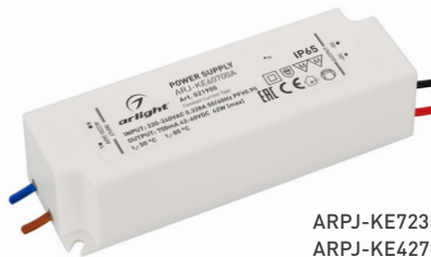
ARPJ-KE72350A ARPJ-KE42700A ARPJ-KE60700A ARPJ-KE401050A