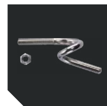
Комплект крепления на трос НВ с витым крюком (код заказа - 2311000150)