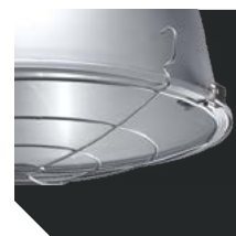
Светильники могут комплектоваться защитной решеткой. Код заказа решетки – 2311000120