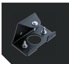
Кронштейн для крепления НВ на трос, профиль, трубу (код заказа - 231000220)