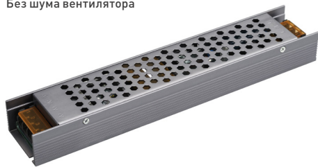
ARS-100-12-L ARS-100-24-L ARS-150-12-L ARS-150-24-L ARS-200-12-L ARS-200-24-L