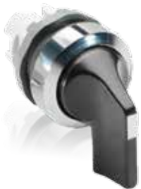
Переключатель с длинной ручкой