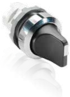
Переключатель с короткой ручкой