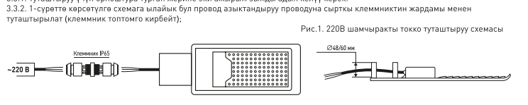
Рис.1. 220В шамчыракты токко туташтыруу схемасы

3.3.3. Токко туура туташканын текшерген соң токту жаңдырса болот.