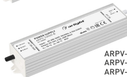
ARPV-12060-B ARPV-24060-B ARPV-12080-B ARPV-24080-B