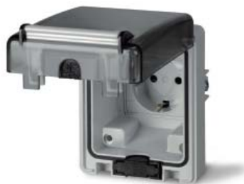
С основанием 70x87 мм