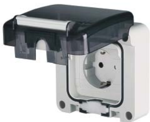
С основанием 95x95 мм