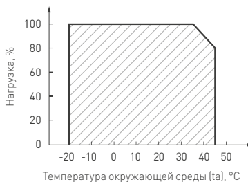
Рисунок 2. Максимальная допустимая нагрузка, % от мощности источника