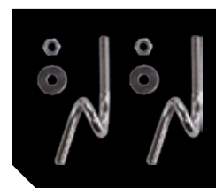
Комплект крепления на трос с витым крюком