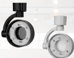
PTR 32 GX53

Адаптер для подключения к однофазному шинопроводу является конструктивным элементом светильника.