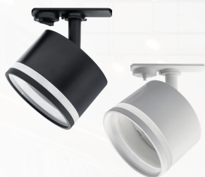
PTR 31 GX53