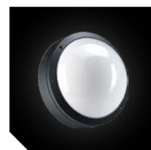
Цвет корпуса – черный