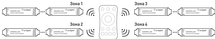
Рисунок 3. Вариант построения системы с 4-зонным пультом дистанционного управления.