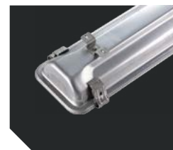
Комплект скоб для крепления на потолок. Код заказа – 2077000030.