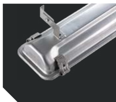
Поворотный комплект крепления на стену. Код заказа – 2077000010.

Возможно изготовление светильника со встроенным датчиком движения.