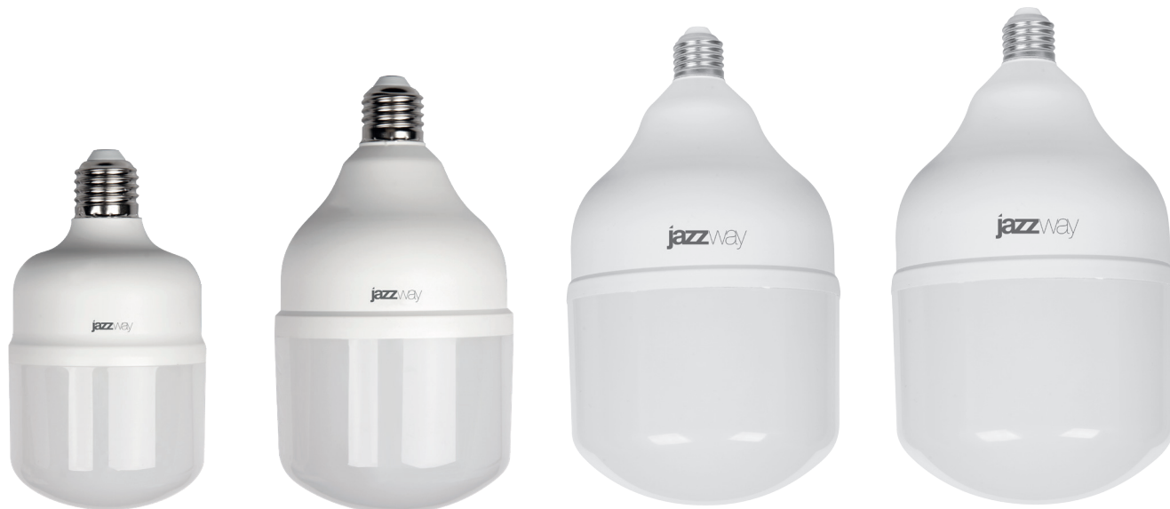
PLED-HP-T80 20W E27