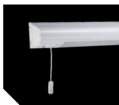
ВН 236 с кнопкой вызова (левосторонний)

Корпус из алюминиевого профиля, покрытый белой порошковой краской. Внутри корпуса установлена пускорегулирующая аппаратура.