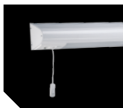
ВН 236 с кнопкой вызова (левосторонний)

Корпус из алюминиевого профиля, покрытый белой порошковой краской. Внутри корпуса установлена пускорегулирующая аппаратура.