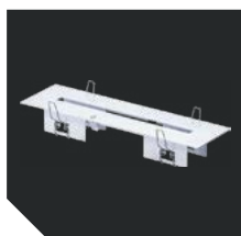
ST 36. Рамка MIZAR SP/SPS/SI