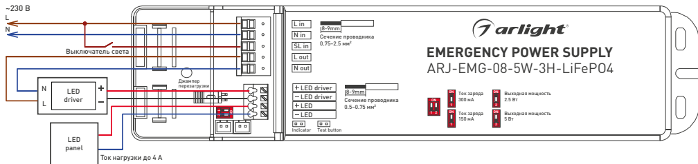
Рисунок 1. Стандартная схема подключения