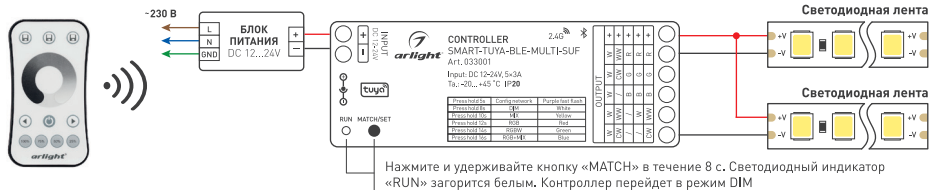
Рисунок 1. Схема подключения контроллера SMART-TUYA-BLE-MULTI-SUF