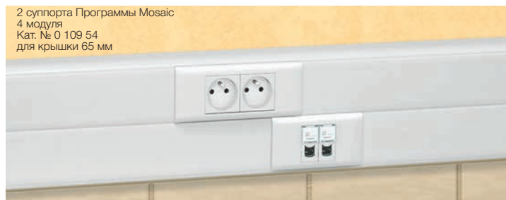
2 суппорта Программы Mosaic 4 модуля Кат. № 0 109 54 для крышки 65 мм