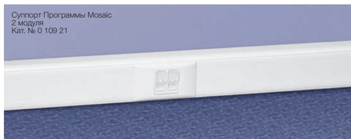
Суппорт Программы Mosaic 2 модуля Кат. № 0 109 21