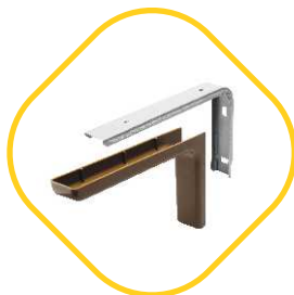
КОНСОЛИ С ДЕКОРАТИВНОЙ НАКЛАДКОЙ