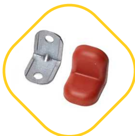
МЕБЕЛЬНЫЕ УГОЛКИ С ПЛАСТИКОВОЙ КРЫШКОЙ