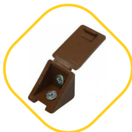
МЕБЕЛЬНЫЕ УГОЛКИ С ШУРУПОМ