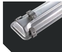
Комплект крепления на трубу. Код заказа – 2077000020.