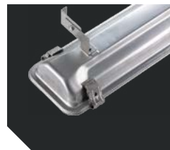
Поворотный комплект крепления на стену. Код заказа – 2077000010.