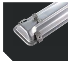
Комплект скоб для крепления на потолок. Код заказа – 2077000030.