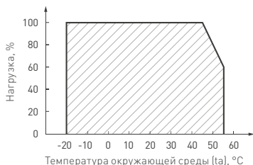
Рис. 3. Максимальная допустимая нагрузка, % от мощности источника