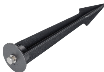
Рисунок 3. Основание для установки в грунт (арт. 024889).