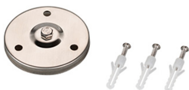
Рисунок 2. Основание для установки на поверхность (арт. 024890).