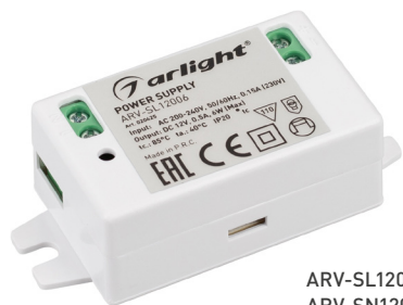
ARV-SL12006 ARV-SN12006-C ARV-SL24006