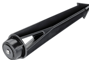
Рисунок 2. Основание для установки в грунт (арт. 024888).