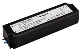
ARPV-LV12060 ARPV-LV12075 ARPV-LV24060 ARPV-LV24075 ARPV-LV24100