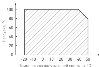
Рисунок 2. Максимальная допустимая нагрузка, % от мощности источника.