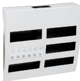
0 782 14 + 0 766 60

Устройства предназначены для вызова персонала в амбулаториях, санаториях, небольших клиниках