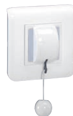
0 766 64

Возможен монтаж в любые 6-модульные суппорты Mosaic (кабельные каналы, стены, настольные розеточные блоки и пр.)