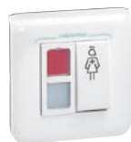
0 782 04