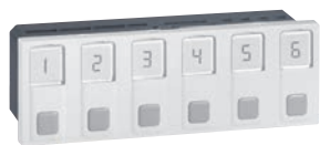
0 766 60