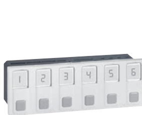
0 766 55

Возможен монтаж в любые 6-модульные суппорты Mosaic (кабельные каналы, стены, настольные розеточные блоки и пр.)