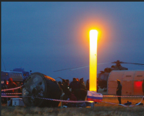
Место посадки спускаемого аппарата пилотируемого корабля «Союз» (Жезказган, Казахстан)