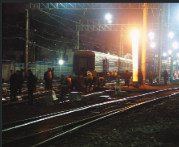
АОУ «Световая башня»