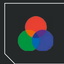
Светофильтры (стр. 270)