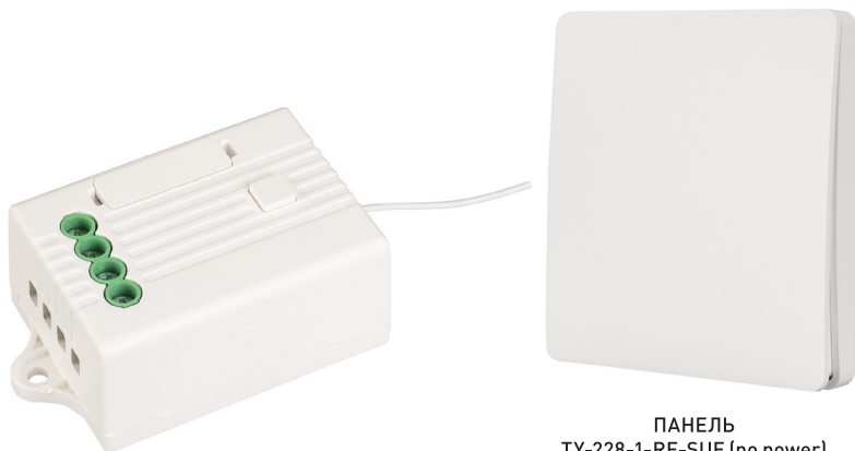
РЕЛЕЙНЫЙ МОДУЛЬ TY-701-WF-SUF (230V, 5A) Арт. 029381