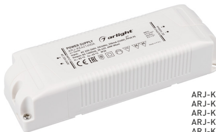
ARJ-KE70700 ARJ-KE86700 ARJ-KE481050 ARJ-KE571050 ARJ-KE301400 ARJ-KE361400 ARJ-KE421400A