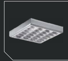
Цвет корпуса – металллик