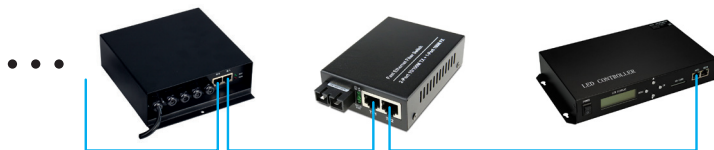
Рис 3. Использование оптоволоконного кабеля и медиаконвертеров для увеличения дистанции передачи сигнала.