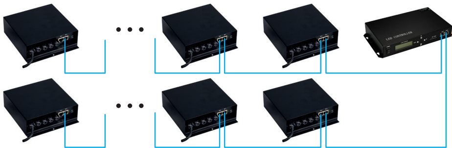
Рис 2. Slave-контроллеры подключаются к двум портам Master-контроллера.