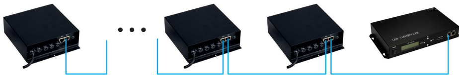
Рис 1. Все Slave-контроллеры подключаются к одному порту Master-контроллера.