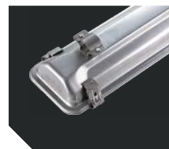
Комплект крепления на трубу. Код заказа – 2077000020.