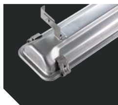
Поворотный комплект крепления на стену. Код заказа – 2077000010.