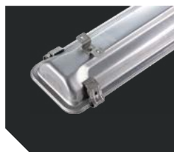
Комплект скоб для крепления на потолок. Код заказа – 2077000030.